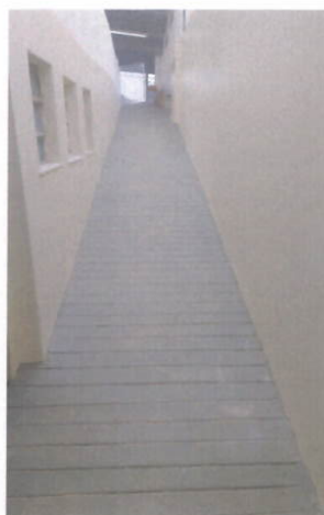
Acesso ao Salão de Eventos e Oficinas