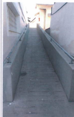
Acesso ao Prédio Superior

CNPJ 34.142.828/0001-04 Rua Guarapuava, 98, complemento 86 e 108 - Inhaúma Rio de Janeiro/RJ CEP 20.765-280 Telefones.: (21) 98208-0248 / 99518-5167 / 99463-1153 E-mail: corbi@mnr.org.br Site: www.mnr.org.br