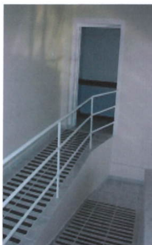
Acesso ao Espaço Multiuso